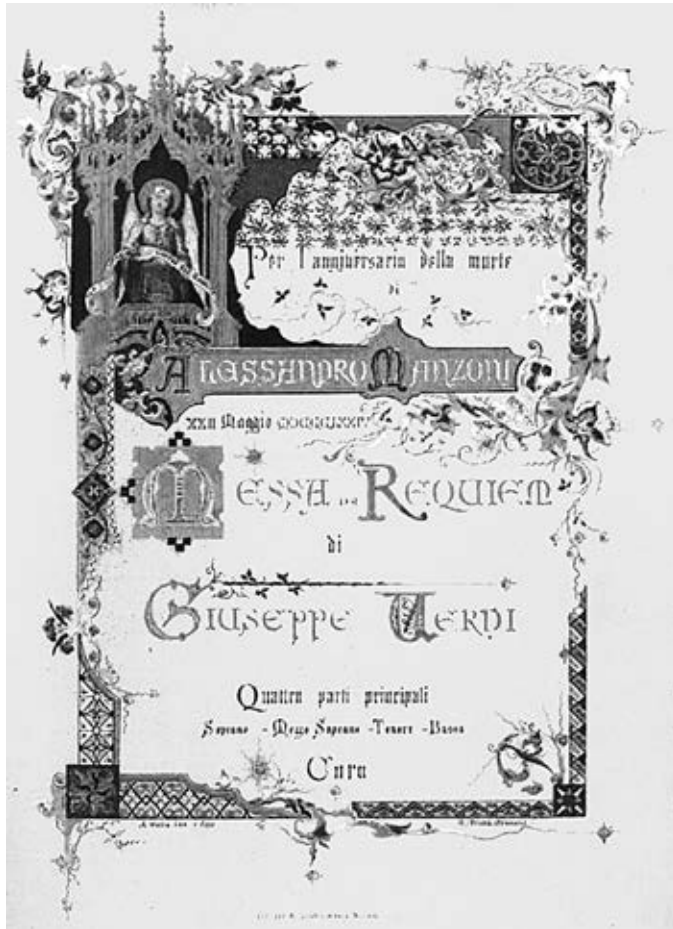
Titelblatt (1874) Giuseppe Verdi, Messa da Requiem

Giuseppe Verdis ergreifende Trauermusik. Bewundert und gescholten – unabhängig davon, ob im Kirchenraum oder Konzertsaal aufgeführt.